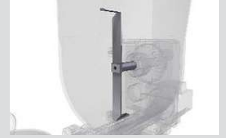
Köprüleşme Önleyici Sistem