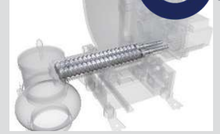
Çift Vidalı Karıştırma Ünitesi